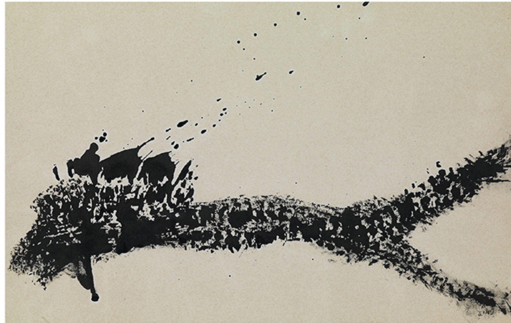
Διανοητικό τοπίο 1979 σινική μελάνη σε χαρτί 29x45 εκ.

Διονυσία Γιακουμή Δρ Ιστορίας της τέχνης-Επιμελήτρια