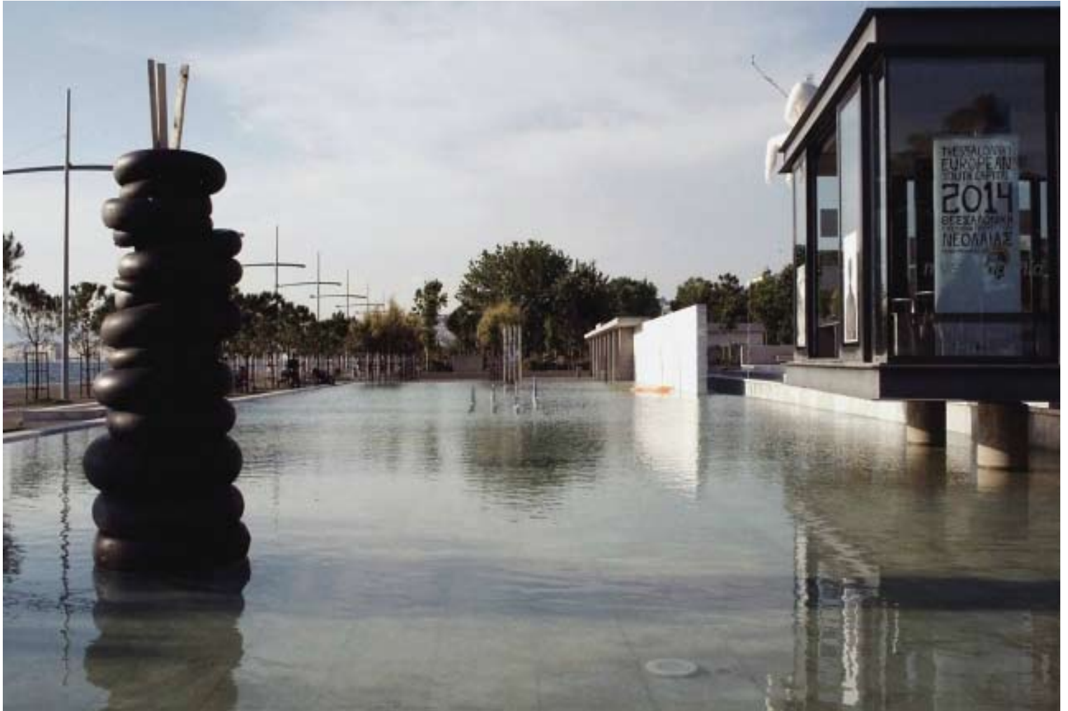
Νικόλ Οικονομίδη, “ατέρμονη στήλη”