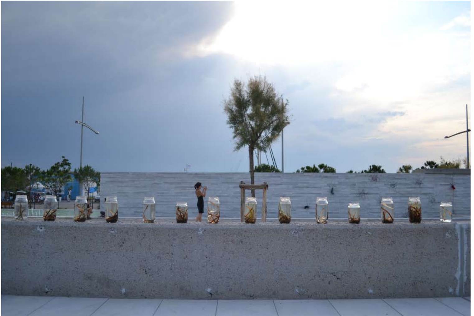
Λίζα Λίβου, “εγκατάσταση”