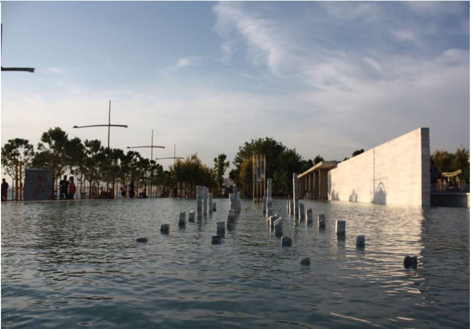
Γιάννης Δελλατόλας “το κύμα”

γλυπτική εγκατάσταση, 1.50 x 5.40 x 1, σύνθεση 36 μαρμάρινων όγκων σε παράλληλη παράταξη (4x9)