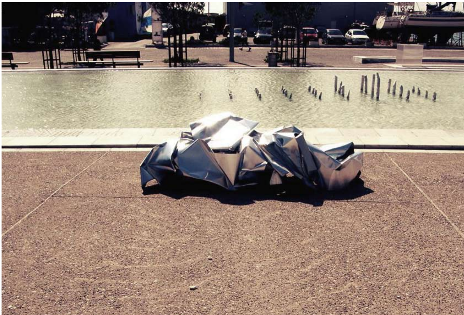
Κατερίνα Καραμήτρου “αποσύνθεση”