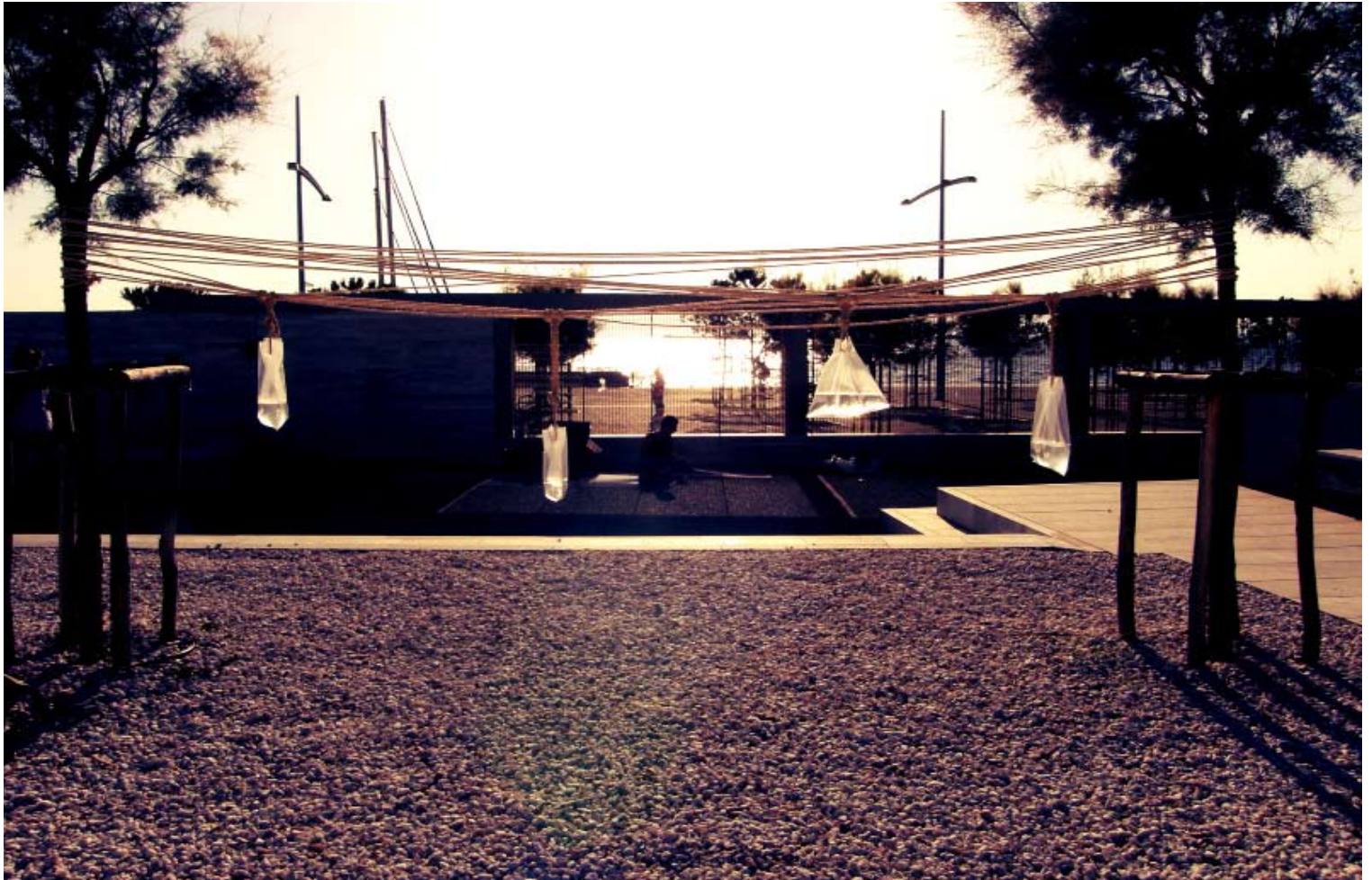
Μαριαλένα Σούλη “100m”

υλικά : 100m τριχιά, πλαστικές διαφανείς σακούλες, νερό, καρφιά και ταινία