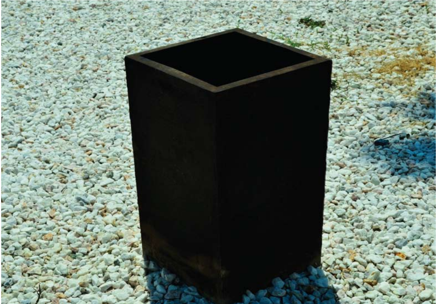
Αναστασία Αγάθου “φρεάτιο”

υλικά: μαύρος σίδηρος, νερό, 0.40 x 0.80