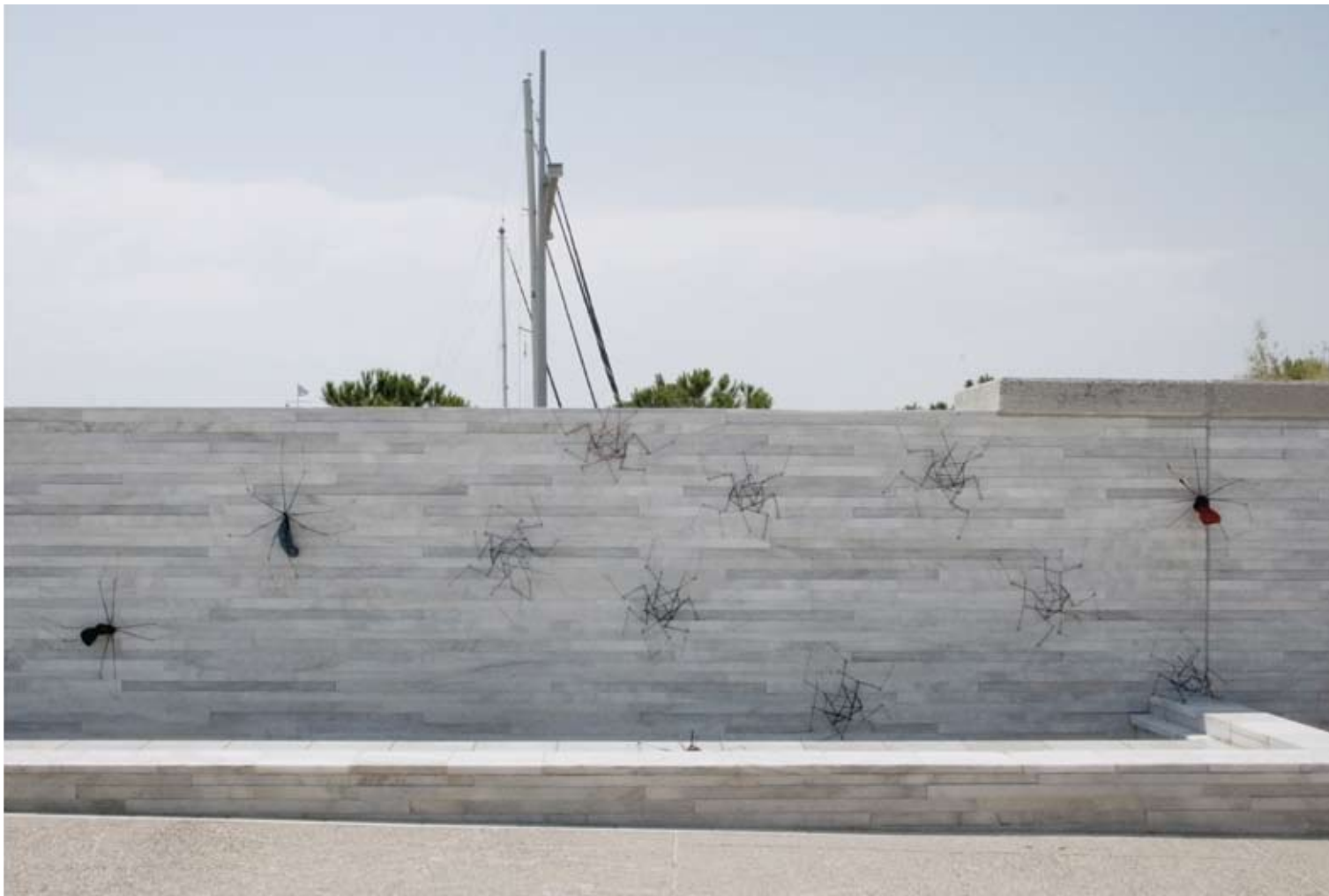
Χρυσοβαλάντω Γεωργίου “καβούρια & αράχνες”

50x50cm, υλικά: σκελετός ομπρέλας και σύρμα