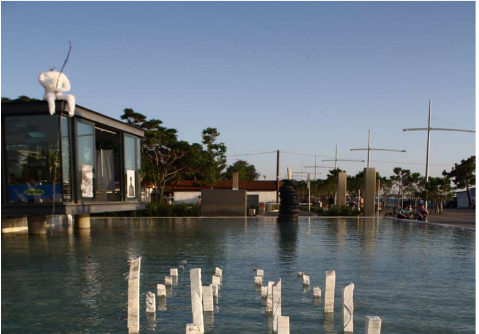
Χριστίνα Χατζηαντωνίου “ο ψαράς”

αεροπλάστ, ταινίες, γυάλα, ξύλο, 1,80 x 1,20