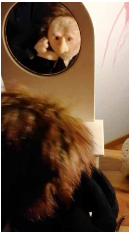
Εβίτα Αγγέλη_Η Δουλα (Video Still)