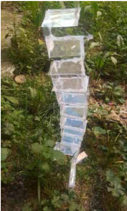
Ιωάννα Τσιγάρα_Mirror Neurons