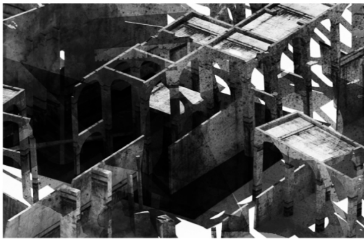
Αναστάσιος Φλώρος_Ruins of Perception