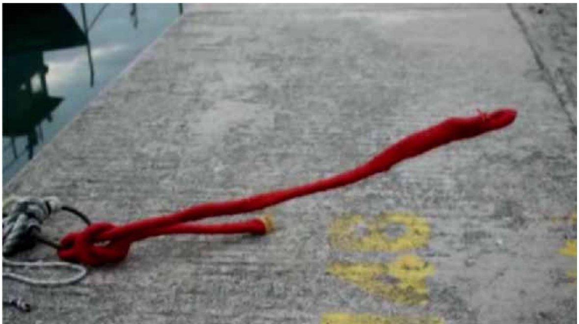
Μαρία Παναγιώτου_Οπτικοακουστικές (video_still)