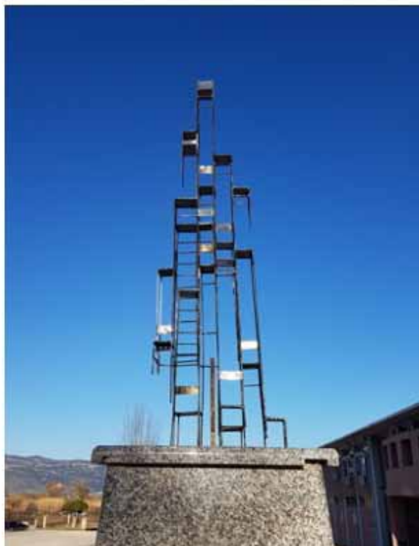
Σπύρος Λιογάρας_Θέση Θέαση