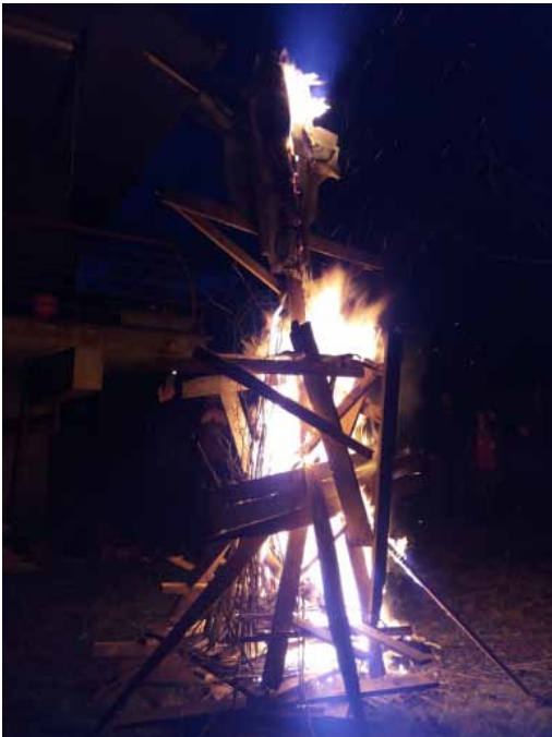
Χριστόδουλος Μανδέλης_I predict a fire