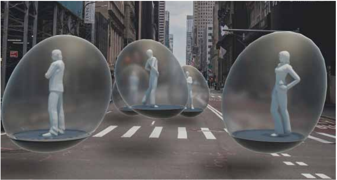
Τάνια Τσαμπαζή_Message in a Bubble