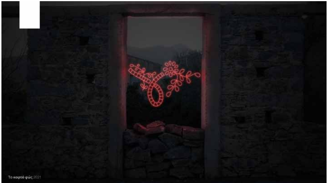
Ίρις Περούλιου Σεργάκη_Το Κοιτό Φως