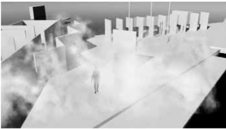
Αναστάσιος Φλώρος_Floating Pavilion_Fog Installation