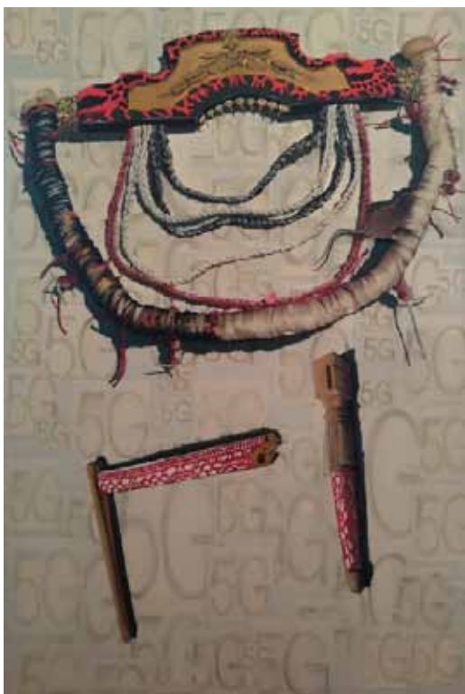
Μαρία Παναγιώτου_Σύγχρονη Καρέκλα Εξουσίας