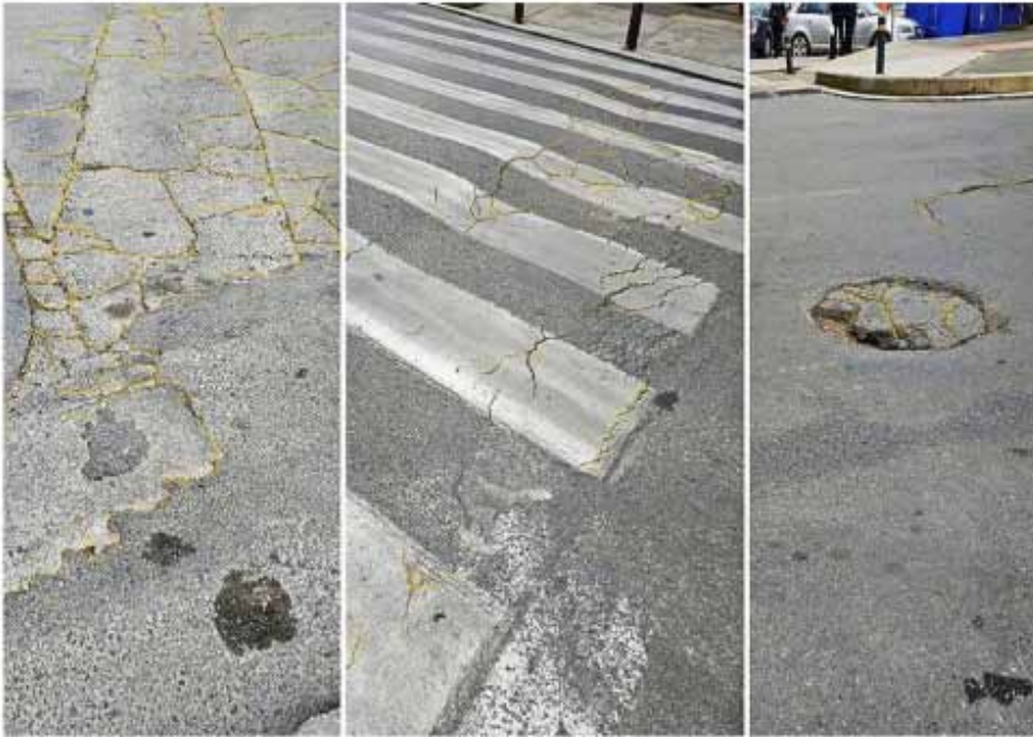
Ιωαννα Τσιγαρα_Χτίζω την πόλη